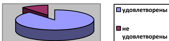
Удовлетворенность родителей дополнительным образованием в 2023 году

Вывод: благодаря внесению необходимых изменений программы дополнительного образования выполнены в полном объеме, в основном удалось сохранить контингент учеников. Исходя из результатов анкетирования учеников и их родителей качество дополнительного образования существенно повысилось.